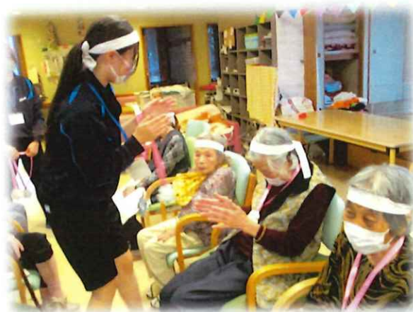
中学生職場体験 運動会