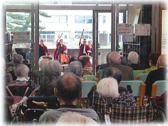
かいさいの華まつり