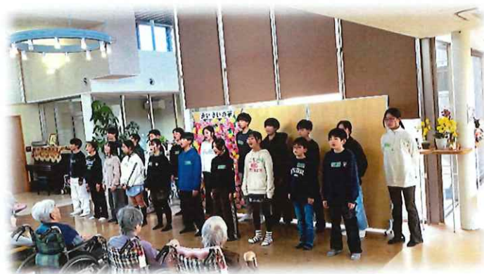
海西小学校生徒訪問