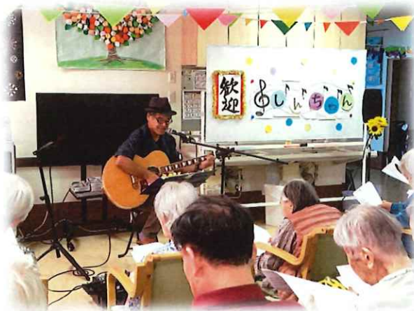
フォークソング ボランティア