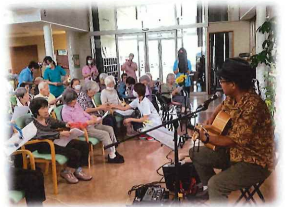
フォークソング ボランティア